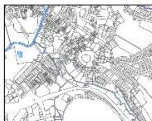
Plan de situation du l'hôtel du Soleil d'Or en 1811