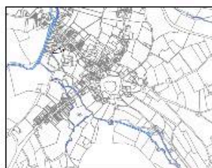
Plan de situation du l'hôtel du Soleil d'Or en 1811